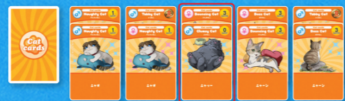
Pick Cat Card pile

4. If a player reveals a Food card that no other player has, this player can take all the cards in one of the Cat card piles at the center of the table. If two or more players have unique food cards, do it in the order of the highest Food card number to the lowest. Players keep their chosen Cat cards face down in front of them. If two or more players reveal the same Food cards, they cannot pick Cat card piles in this round.